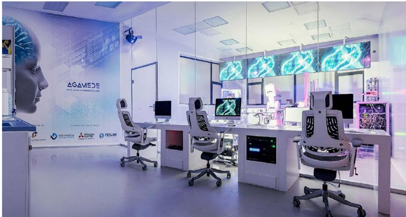
Sdílená AI laboratoř (referenční obrázek)