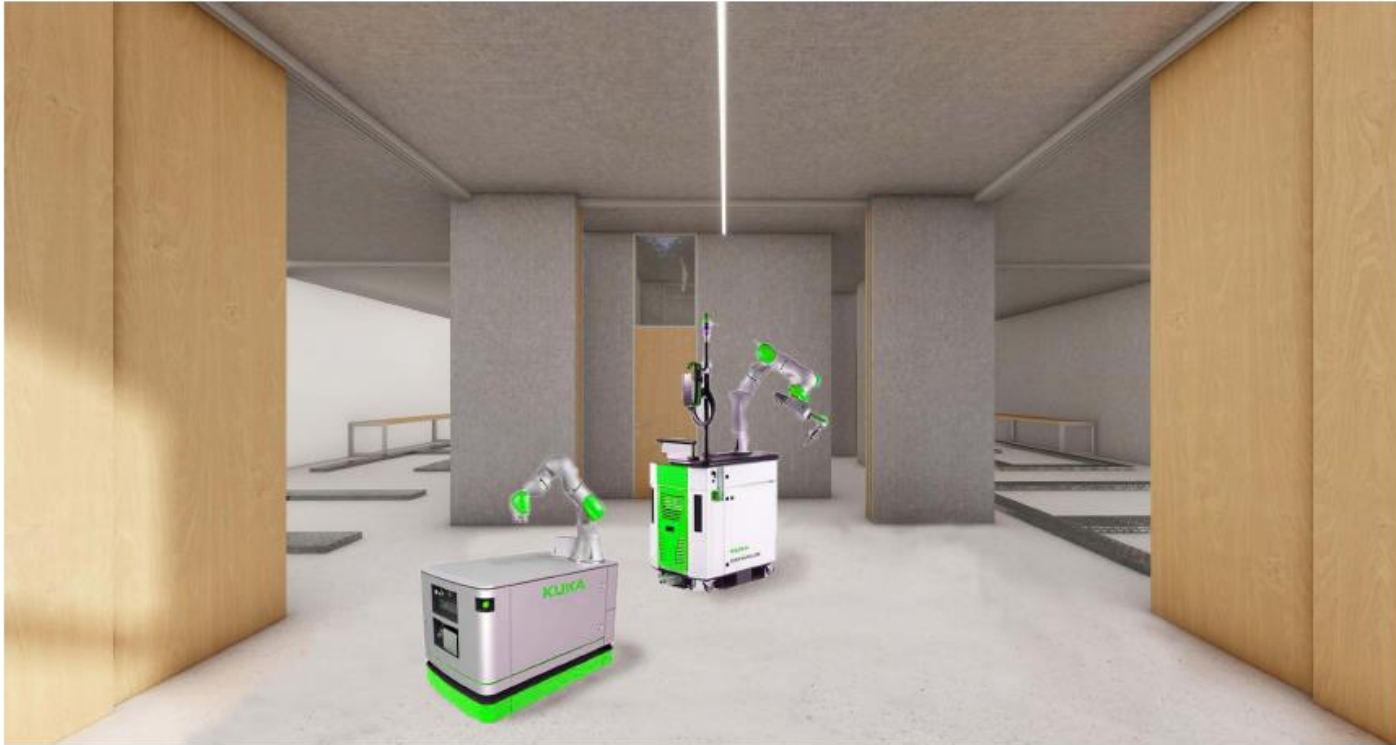
Sdílené technické laboratoře